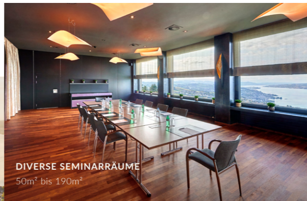
DIVERSE SEMINARRÄUME 50m 2 bis 190m 2

Bei uns finden Sie über 10 Event- und Seminarräume, sowie 8 Sitzungsräume mit fantastischer Seesicht über den Zürichsee und professioneller Infrastruktur.